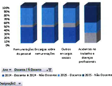
Gastos com o Pessoal